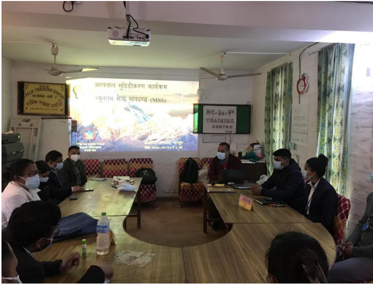
न्यूनतम सेवा मापदण्ड (MSS) कार्यक्रमको प्रस्तुतिकरण गर्दै स्वास्थ्य निर्देशनालको टोली