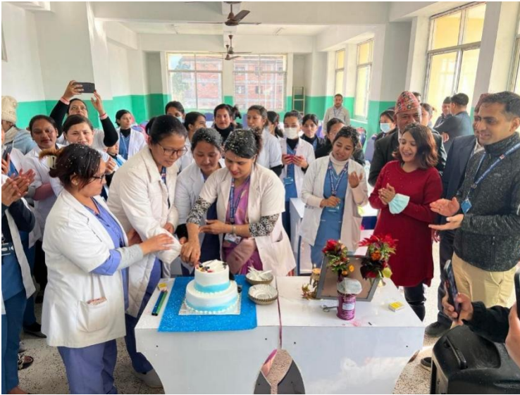
६१औ नर्सिङ दिवसको अवसरमा केक काट्दै नर्सिङ अधिकृतहरु