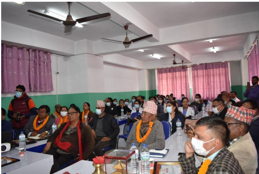
६४औं वार्षिकोत्सव समारोहमा सहभागिहरु