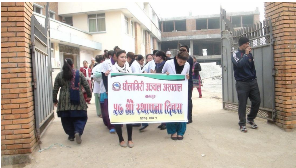
५७औं स्थापना दिवसको अवसरमा प्रभात फेरी कार्यक्रम