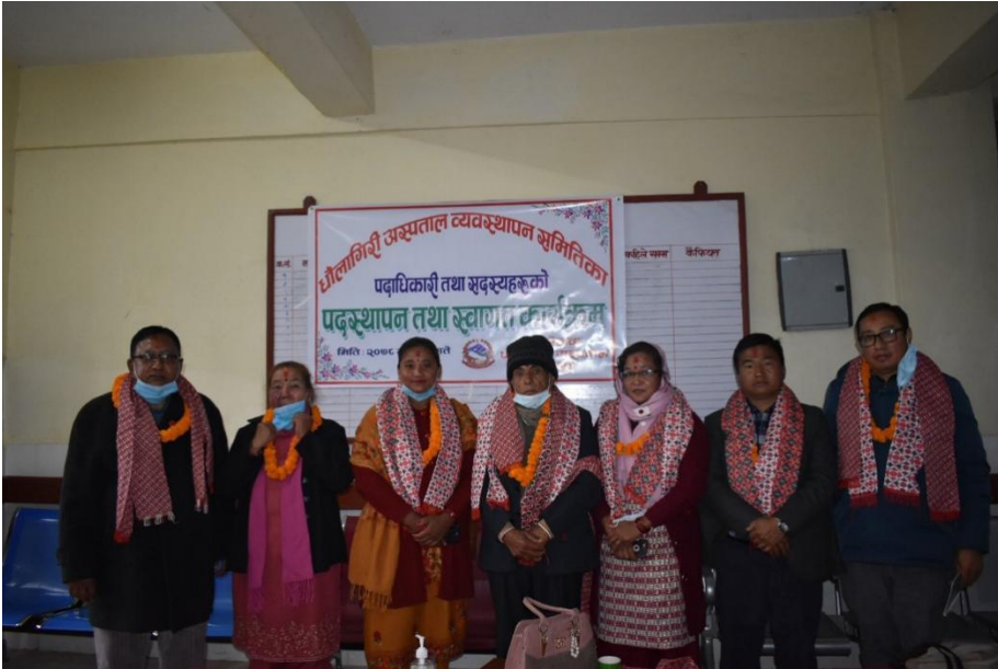
नवनियुक्त अस्पताल व्यवस्थापन समितिलाई स्वागत कार्यक्रममा समितिका अध्यक्ष एवं सदस्यहरु