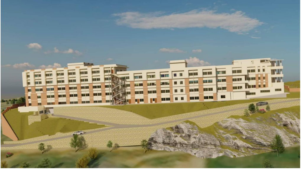
अस्पतालको A,B,C,D,E ब्लक निर्माण पछि सम्पन्न अस्पताल २०० वेड सहितको