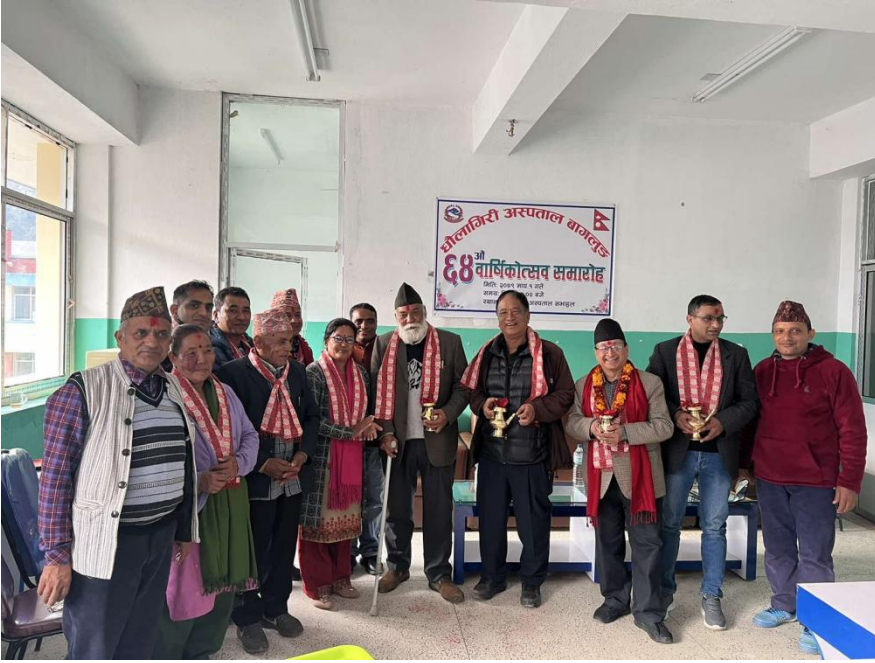
६४औं वार्षिकोत्सव कार्यक्रममा पूर्व अध्यक्षहरु वर्तमान अध्यक्ष, सदस्य र अन्य कर्मचारीहरु